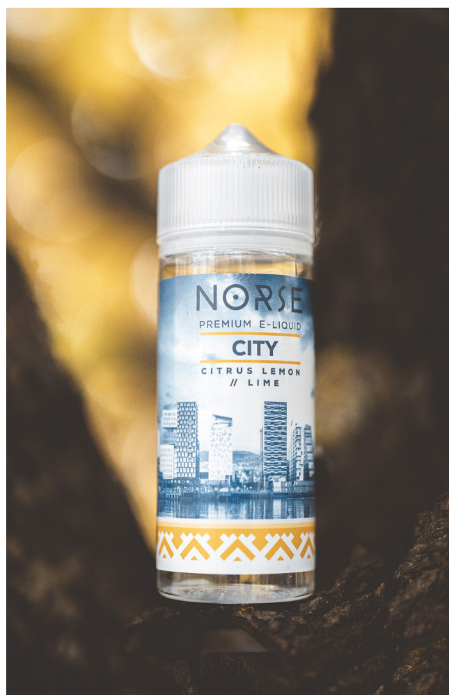
NORSE - HARM REDUCTION GROUPS EGNA VARUMÄRKE