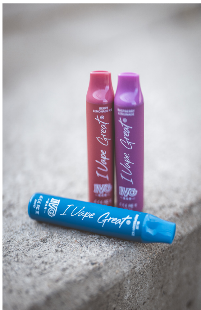
IVG - HARM REDUCTION GROUPS MEST SÅLDA PRODUKT INOM RETAIL

Affärsverksamheten, produktutvecklingen och produktionen drivs samtliga med samma ambition, hög kundnöjdhet och bra kvalitet. Bolaget erbjuder kontrollerade och legala produkter på marknader där produkterna är reglerade och där tillväxt finns.